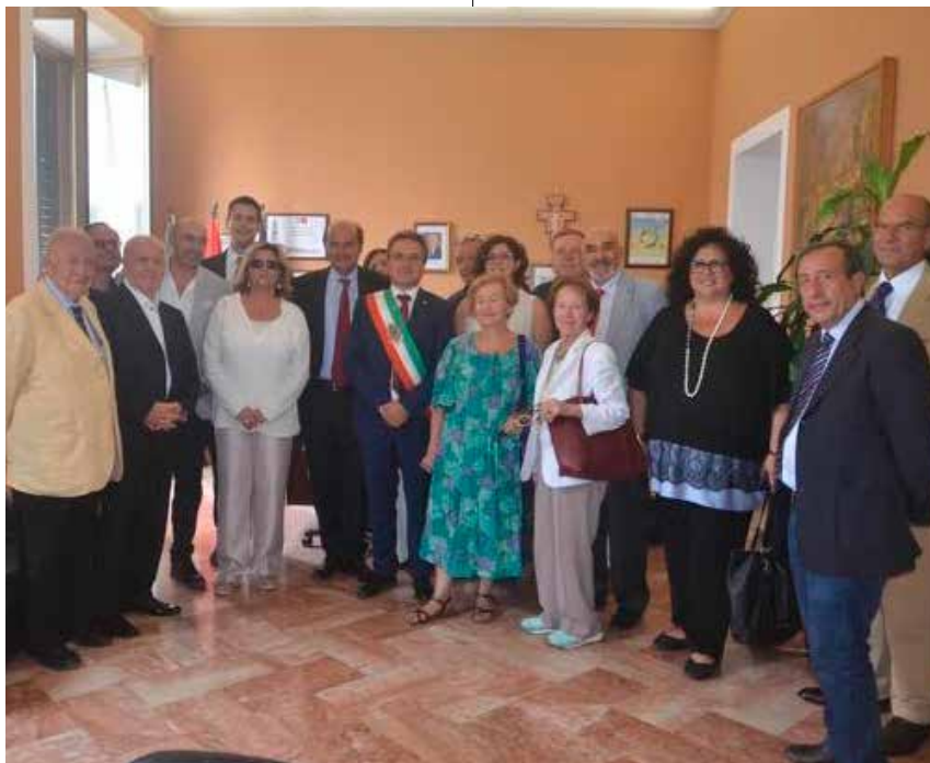
SAMBUCA - IL SINDACO ACCOGLIE L'ON. BERSANI

Qui, in questo brusco risveglio, l'origine embrionale della complessa e drammatica relazione fra grande cultura socialista e la reinterpretazione (così la definisco, da emiliano) che ne diede il PCI nel resto del secolo. Un bivio cruciale che si intravede drammaticamente nella vita di